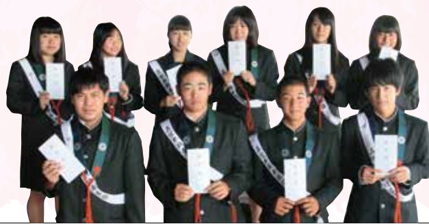
小松大谷高等学校上山研修